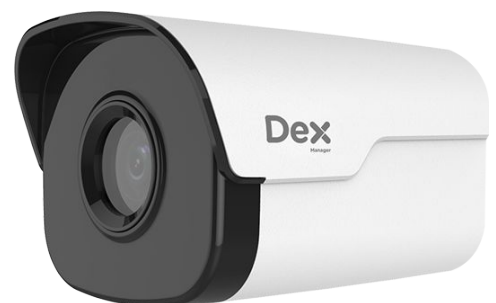
Cámara termográfica para visualización de temperatura en tiempo real.