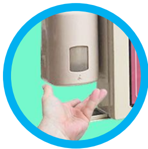
3- Dispenser Industrial