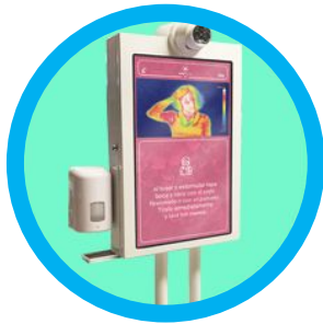
2- Stand Alone