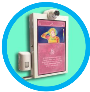
1- Montaje a pared