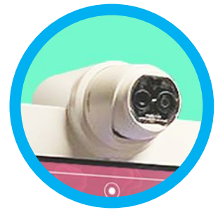
4- Cámara termográfica