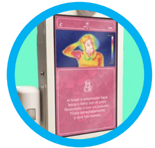
5- Pantalla profesional